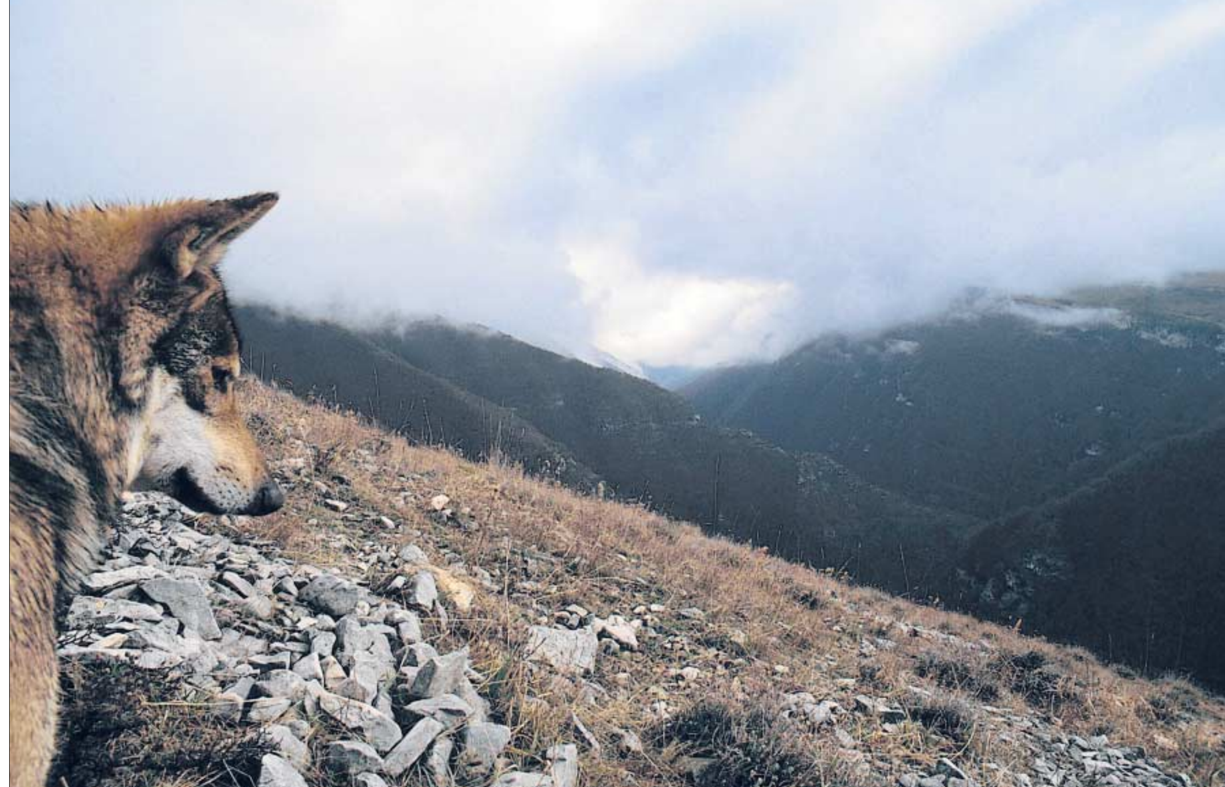
In der Welt der Märchen und Sagen fürchtet man den Wolf als Menschenfresser. In der Realität ist er ein äusserst scheues Tier, das schwierig zu beobachten ist. Im Bild ein Wolf aus dem Abruzzen-Nationalpark in Italien.