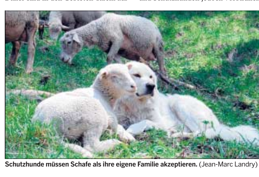
Schutzhunde müssen Schafe als ihre eigene Familie akzeptieren.