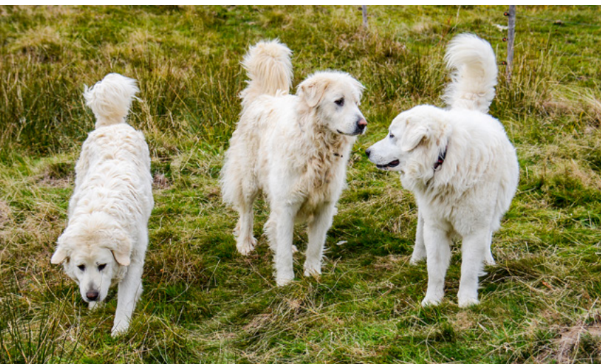
Herdenschutzhunde sind Teamplayer. Les chiens de protection des troupeaux sont des équipiers.