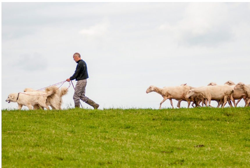
Das Management eines grösseren Hunderudels ist anspruchsvoll. La gestion d'une meute de chiens d'une certaine taille est exigeante.

Mais on entend ou lit aussi souvent qu'il n'y aurait pas suffisamment de chiens de protection des troupeaux disponibles à l'échelle nationale. En rétrospective des dernières années, on peut dire que cette affirmation est erronée. En jetant un regard vers l'avenir, il n'est naturellement pas (encore) possible de le vérifier.