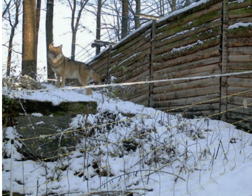
Verstärktes flexibles Weidenetz bei Wolfpräsenz (Sachsen). Filet de pâturage renforcé en présence du loup (Sachse).

Compte tenu de cette situation, l'éleveur de petits