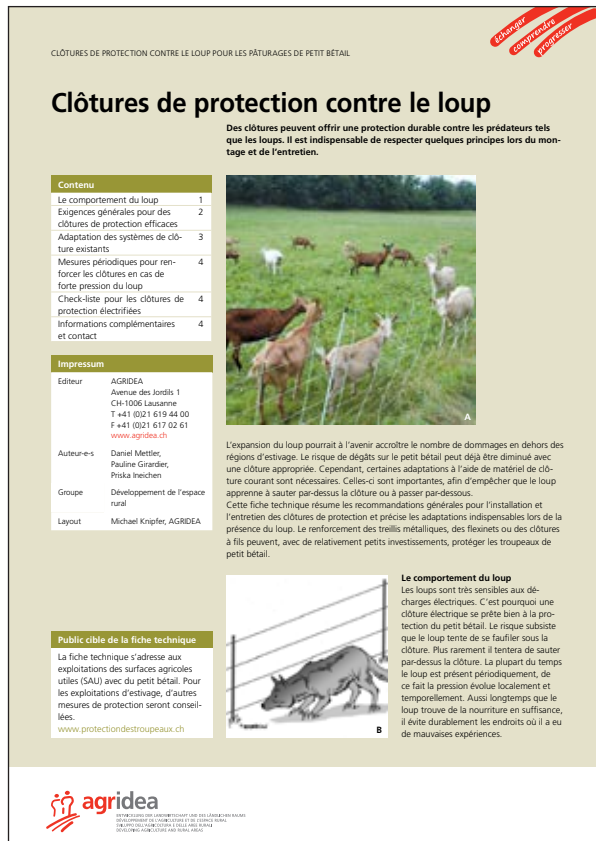
Fiche technique sur les clôtures d'Agridea.

Les nouvelles bases légales relatives à la protection des troupeaux sont entrées en vigueur avec l'ordonnance révisée sur la chasse (OChP) le 1 er janvier dernier. A l'avenir, les cantons seront compétents en matière d'évaluation du financement du matériel de clôture pour la protection des troupeaux. Compte tenu du fait que 2014 est une année transitoire en termes de mise en œuvre de l'OChP et que les directives et aides à l'exécution sont en cours d'élaboration, Agridea demeure compétent en matière de matériel de clôture pour cette année. Cela signifie que les formulaires de demande de soutien pour le renforcement des clôtures doivent être commandés auprès de celui-ci. Les demandes sont ensuite évaluées en commun avec la vulgarisation agricole des cantons. Dès 2015, ce processus devrait se faire directement via les organes cantonaux. Outre le renforcement des clôtures existantes sur les surfaces agricoles utiles, on peut toujours financer les filets de pâturage flexibles pour la mise en place d'enclos de nuit pour l'estivage.