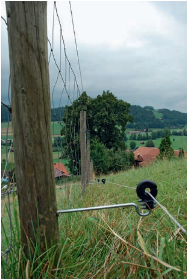
Elektrifizierter Stoppdraht beim Knottengitter. Fil d'arrêt électrifié sur le treillis à nœuds.

etwa CHF 90.00/100 m Zaun. Gemäss der neuen Jagdverordnung (Art. 10ter JSV) kann dieser zusätzliche Aufwand durch Bund und Kantone entschädigt werden. Zusätzliche Arbeit und Zaungeräte werden nicht abgegolten.