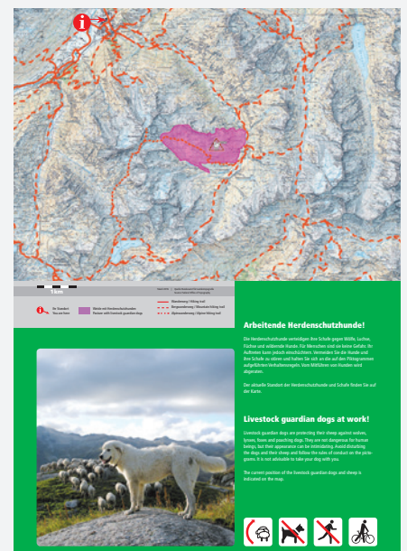
Esempio per un inserto doppio per una tavola di base grande (Luogo: Andermatt UR)