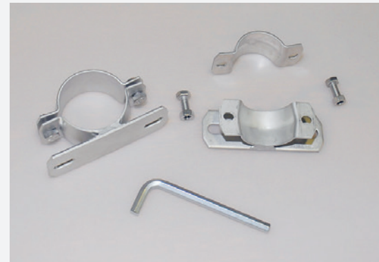
Il materiale di montaggio viene consegnato insieme alla tavola.

Il montaggio pratico dei cartelli nel luogo di ubicazione corretto rientra poi nell'ambito di responsabilità del rispettivo responsabile aziendale e/o responsabile d'alpeggio.