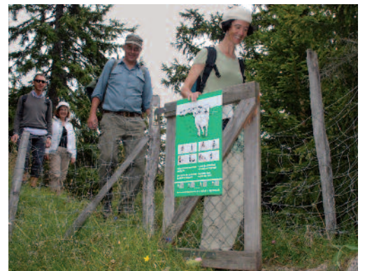
Durchgänge zu Weiden müssen bedienungsfreundlich, sicher gebaut und unterhalten sein.