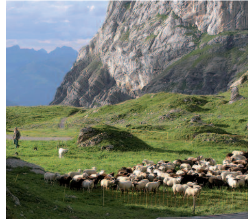
Der Einsatz von HSH erfordert von den Betreuungspersonen zusätzliches Wissen und Erfahrung.