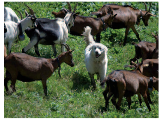
Es sind nur geeignete und registrierte HSH einzusetzen.

Wird eine befristete oder eine definitive Wegverlegung geplant, so hat diese in Zusammenarbeit mit dem Wanderwegverantwortlichen und der Gemeinde zu erfolgen. Es wird die offizielle Signalisation verwendet. Eigenkreationen sind nicht zugelassen. Durch Drehen oder Montieren/Abmontieren eines Signals am Anfang und am Ende des betroffenen Abschnitts, werden Wandernde und Bikende in die eine oder andere