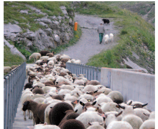
In kritischen Bereichen und Zeiten, insbesondere in der Nähe von Wegen und Strassen, HSH beim Weidewechsel an die Leine nehmen.