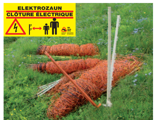
Der Einsatz von mobilen Zäunen kann die Risiken reduzieren.