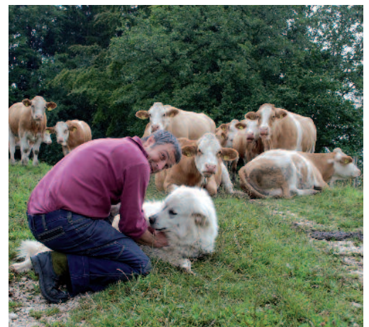
Es sind regelmässig Kontrollgänge durchzuführen und es ist ein intensiver Kontakt zu den HSH zu pflegen.

Die wichtigsten Verhaltensregeln können mit Hilfe des Merkblatts «Schutzhunde bewachen ihre Herde» weitergegeben werden.