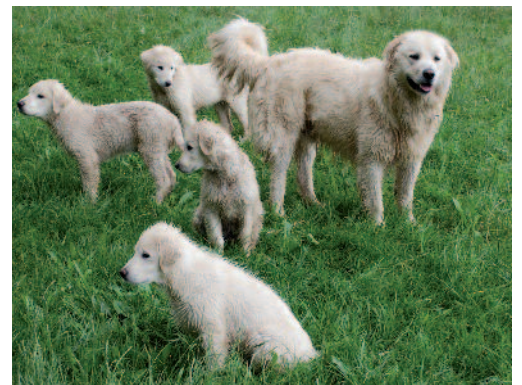
Keine unerfahrenen Junghunde an Wanderwegen und Bikestrecken einsetzen.

Vorkommnisse sind zu analysieren und umgehend der Fachstelle Herdenschutz Hunde zu melden (021 619 44 31, info@herdenschutzschweiz.ch).