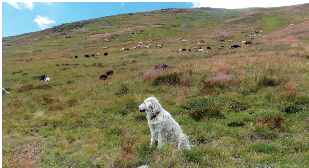
I CPG vengono impiegati almeno a due a due. Essi si sparpagliano nel gregge/mandria.