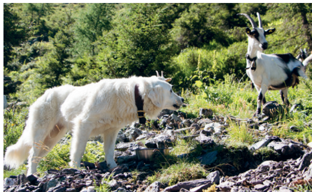
I CPG ricevono da mangiare tutti i giorni, se possibile in una ciotola. Attenzione: al momento del pasto possono sorgere rivalità sia con il bestiame che con i cani da conduzione.

I CPG mantengono fino a circa 10 anni di età la forma fisica necessaria per proteggere gli animali da reddito. È importante pianificare per tempo la successione dei CPG.