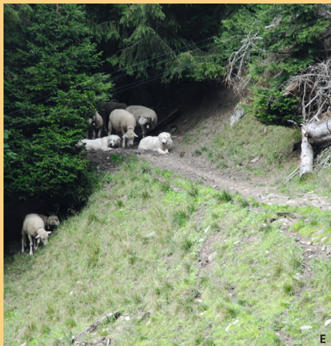
Situazioni di questo genere presentano un maggior rischio di incidenti tra i cani da protezione e gli escursionisti e devono essere individuate in anticipo. Il gregge e i cani devono essere tenuti lontani dai sentieri, in particolare nei punti che presentano delle strozzature e soprattutto durante l'alta stagione escursionistica.