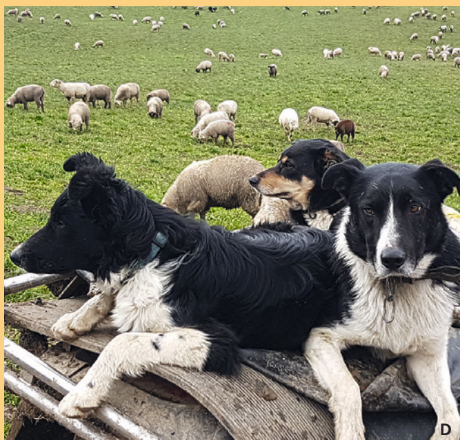
Il personale deve tenere i cani da fattoria e i cani da conduzione costantemente sotto controllo.

Fattori esterni quali il momento del giorno, la situazione meteorologica, la presenza di predatori e così via influenzano lo stato di vigilanza e la reattività dei cani da protezione, ma né il proprietario dei cani né altri hanno modo di influenzare queste circostanze. Non da ultimo, anche il comportamento della persona o dell'animale (escursionista, cane da compagnia ecc.) che si trova di fronte al cane da protezione svolge un ruolo molto importante.